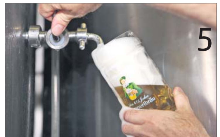
Vom Einbrauen bis zum Ausschank bedarf es acht Wochen. Danach kann man sich den Gerstensaft schmecken lassen.